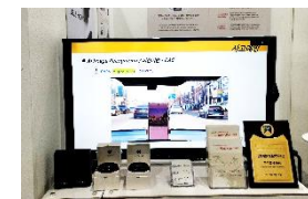
2022 WIS 참여기업 선정