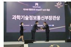
2022 WIS 과학기술정보통신부장관상