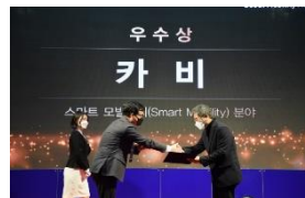
2021 서울모빌리티어워드 우수상

지역 내 도로의 사고 위험도를 평가하고, 사고 위험이 높은 도로의 원인을 분석하여 미래 교통사고 발생률을 예측합니다. 이를 통해 사고가 발생하기 전에 위험도가 높은 도로를 정비하거나 인프라를 재배치 하여 교통사고를 예방하도록 도와줍니다.