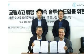
카비-한국교통장애인협회 업무협약 (MOU)