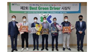
카비-도로교통공단 Best Green Driver 대회 개최